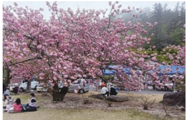
▲昨年のさくら祭りの様子

また、麒麟ビール株式会社による寄付活動『晴れ風ACTION』の寄付先の一つとして、琴浦町が選ばれたため、今回の船上山さくら祭りにも、この寄付金を活用しています。