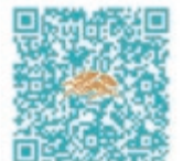
▲麒麟ビール 晴れ風ACTION

主催 船上山さくら祭り・紅葉フェス実行委員会 共催 船上山少年自然の家 後援 琴浦町