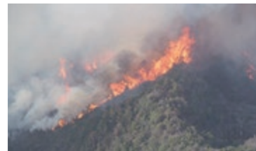
（総務省消防庁HPより抜粋）

また、裸火の取り扱いにつきましては、林野火災注意報発令時はもとより、日ごろから十分注意し、火災予防に努めましょう。