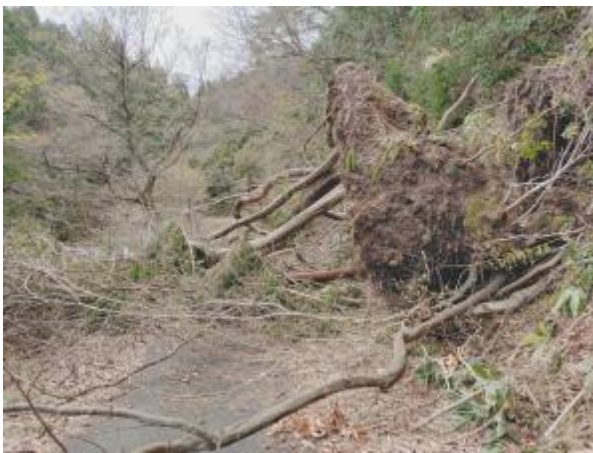
大小7本の倒木、土砂を巻き込んでの根返り