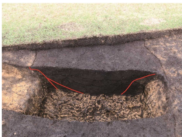
南辺区画溝の掘り直しとみられる痕跡(トレンチ21)