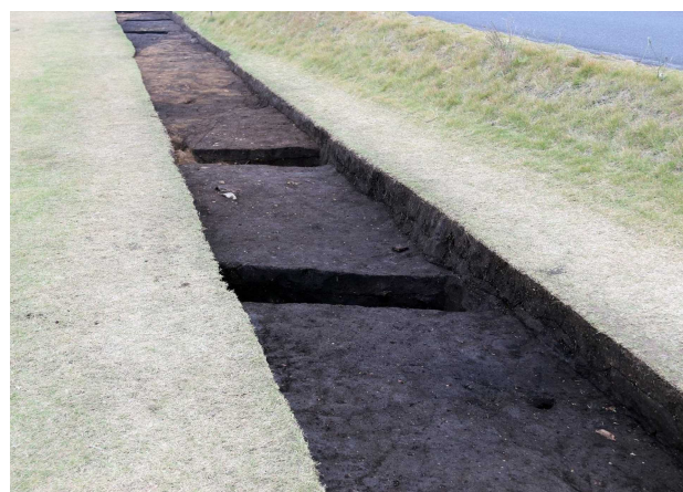
史跡北西部で新たに確認した溝状遺構(トレンチ8)