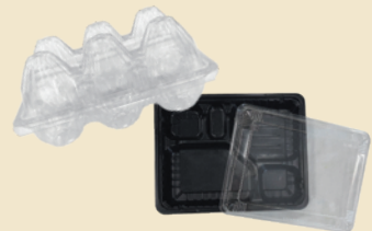
卵パック・弁当容器