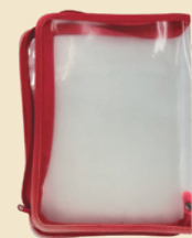
チャック付き ファイル