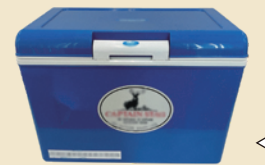
クーラーボックス