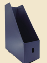
プラスチック製の 書類立て