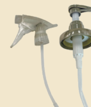
スプレー容器などの ポンプ部分