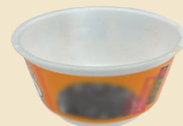
カップラーメン容器