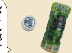
ペットボトルの キャップとラベル