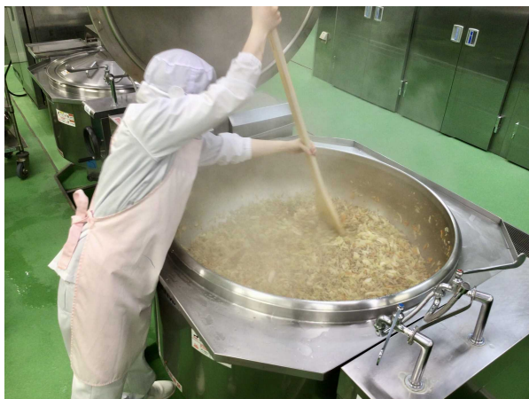
琴浦の夏やさいたっぷりみそ汁