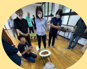
簡易トイレに興味津々