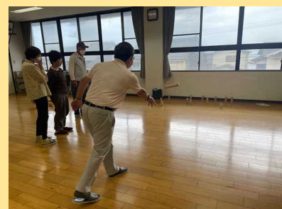
訓練の後はモルックを楽しみました！