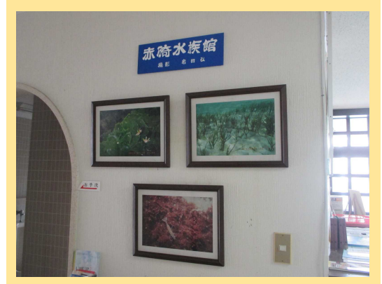
「赤碕水族館」