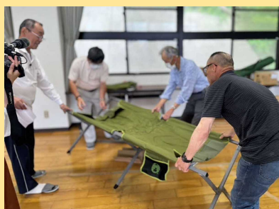
意外と難しいベッドの組み立て