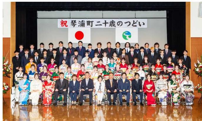
令和7年 琴浦町 二十歳のつどい 令和7年1月3日 於 琴浦町赤碕地域コミュニティーセンター