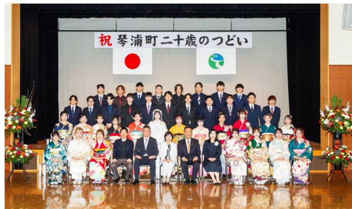
令和7年 琴浦町 二十歳のつどい 令和7年1月3日 於 琴浦町赤碕地域コミュニティーセンター