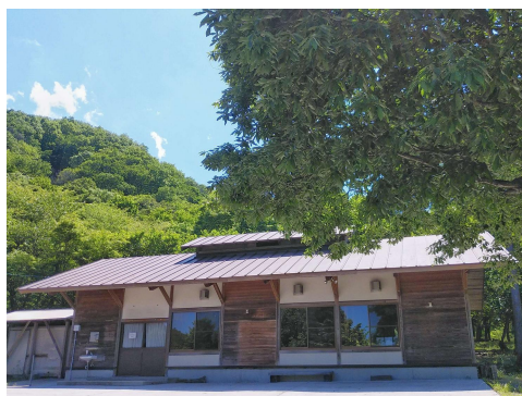
▲バーベキューハウス