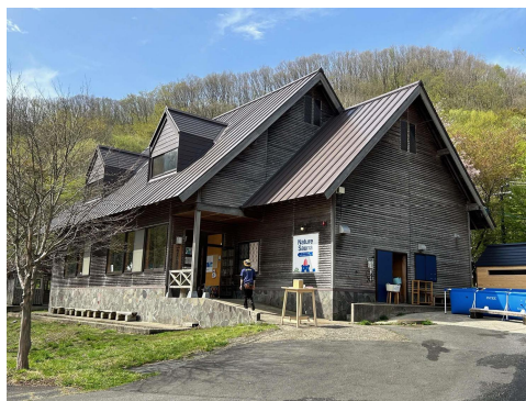
▲森林体験・交流センター(サウナ施設含む)