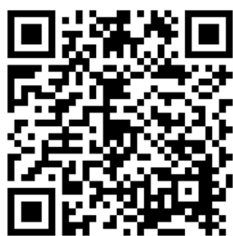
二次元バーコード

ねんりんピック鳥取大会琴浦町実行委員会事務局（社会教育課） 及び 同大会琴浦町運営委員会広報部