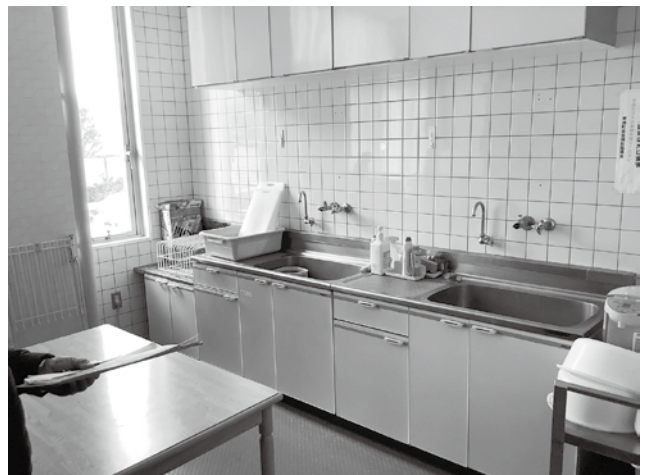
ガスが使えず調理ができない給湯室(浦安地区公民館)