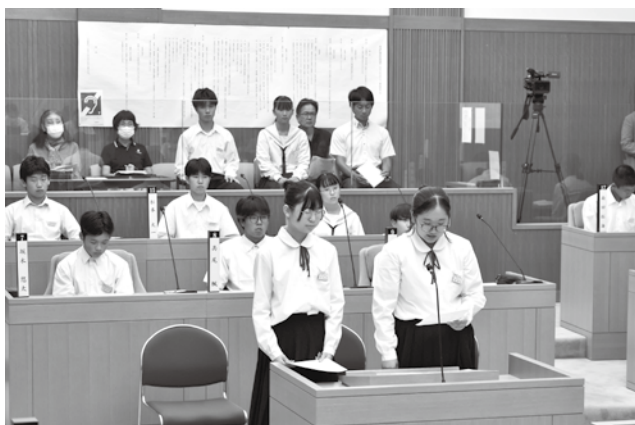
8月22日に開催された中学生議会

町としては令和13年までに山の持ち主に対して山についての意識調査を行い、今後自分で経営が出来るのか、業者に委託するのかなど調査を進め、長期計画の中でどこに使うのが一番有効か考えたいと思っている。 福本町長