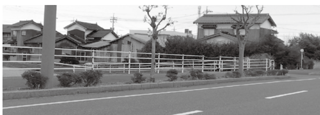
都市計画道路の街路樹

草刈りの頻度も多くなっており、ワークセンターが抱える範囲など、全体的な見直しをやっていきたい。