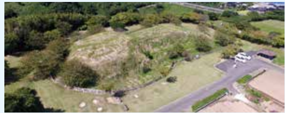
町指定史跡 狐塚古墳

最後に人です。私が琴浦町でお会いした方々はとても優しく親切で温かい方々が多く人と人のご縁を感じます。これからもこの大好きな琴浦町で楽しく笑顔で暮らしていきたいと思っています。