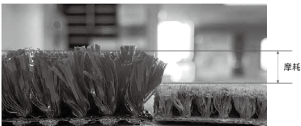
使用前の人工芝 使用により摩耗した人工芝