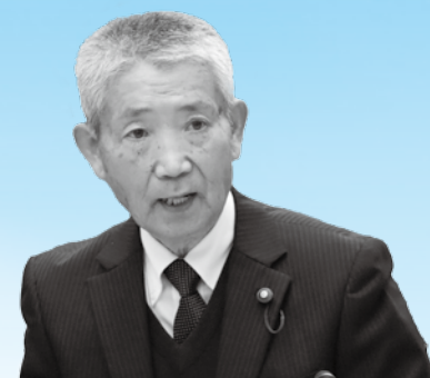
手嶋 正巳 議員

新たな不登校を生まない学校づくりと、社会的自立を目指すきめ細やかな支援、対策を行っていく 河原教育長