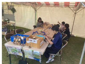
▲船上山少年自然の家クラフト