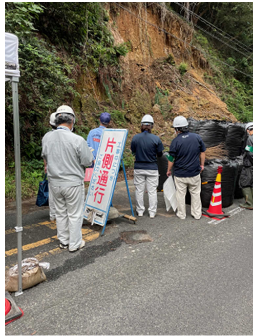
9月25日に行われた災害査定（実地）第26号の様子