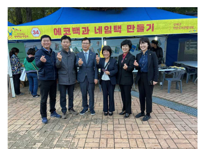
合江(ハッカク)文化祭出席