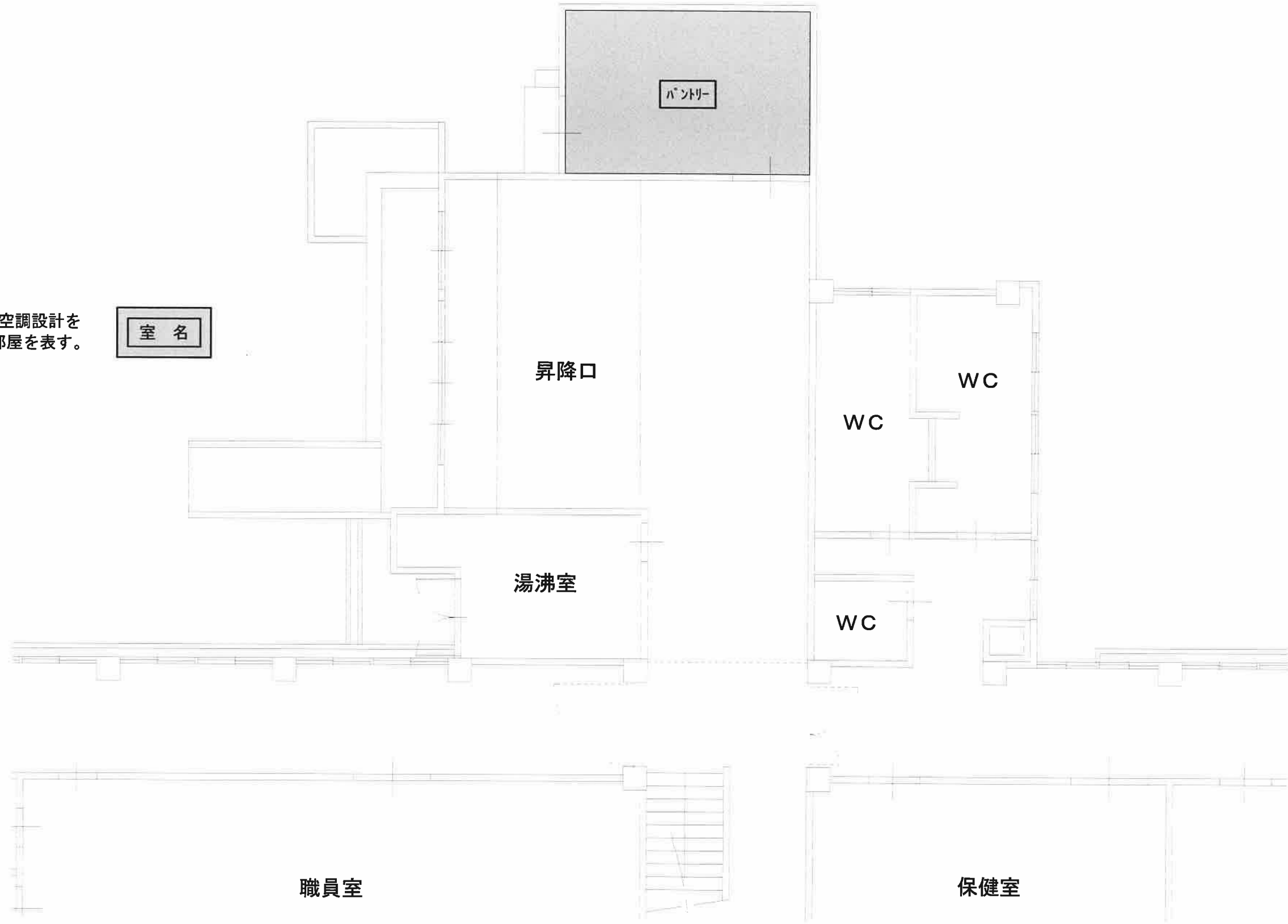
管理教室棟1階平面図 S=1/100