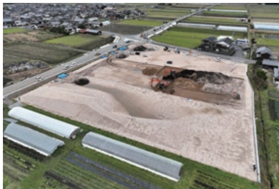
現在の建設予定地

工事の着工に伴い、周辺道路では工事車両などの通行が増えますので、周辺の住民および通行される皆さんにはご迷惑をおかけすることもあります。ご理解とご協力をお願いします。