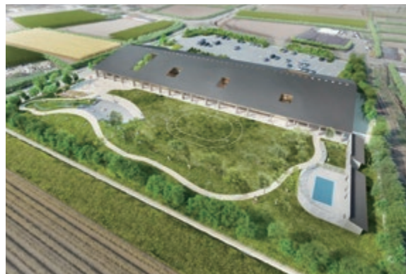
完成後のイメージ図

工事の着工に伴い、周辺道路では工事車両などの通行が増えますので、周辺の住民および通行される皆さんにはご迷惑をおかけすることもあります。ご理解とご協力をお願いします。