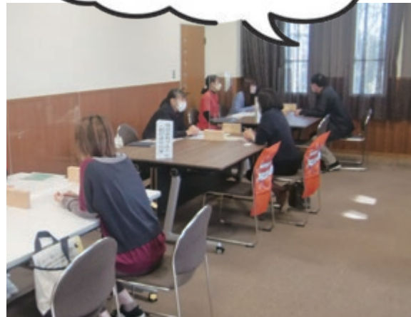
昨年度の説明会の様子