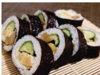
東宝ストアの人気商品「倉吉土蔵巻き寿司」。毎日店頭で並ぶそうなので、ぜひ一度手に取っていただきたい。