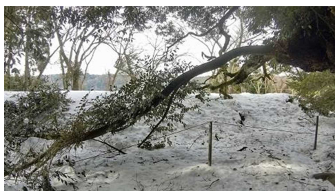
伯耆の大シイ折損状況