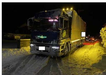
町道駅前桜ヶ丘線スタック状況