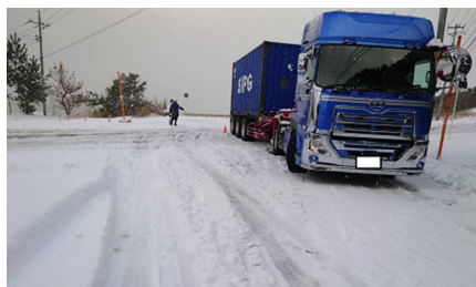
県道大栄赤碕線のスタック状況