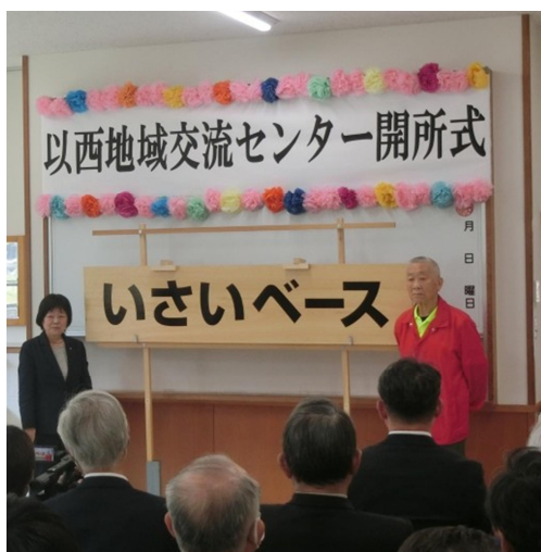
愛称「いさいベース」の看板