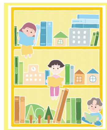
デザイナーのイラストイメージ ※車両のイラストは異なります。