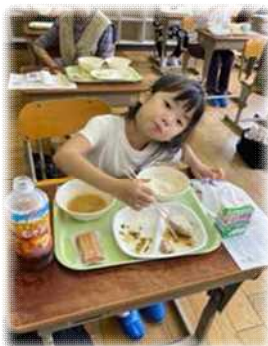
↑5歳の女の子も参加してくれました!おばあち やんと一緒に、1年生気分で給食を食べました。