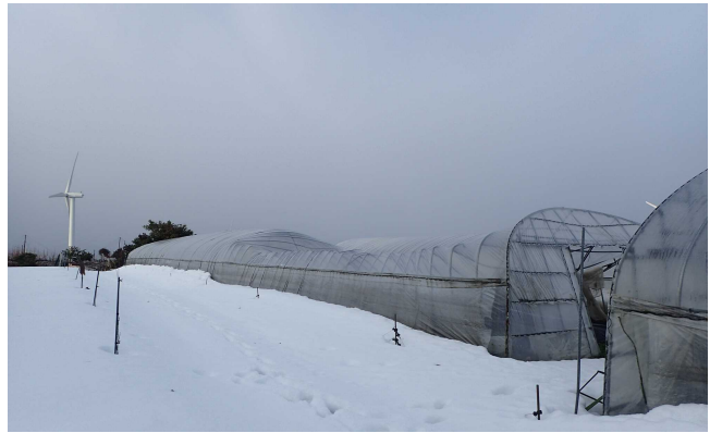
ビニールハウス (西高尾)

(総事業費) 9,200千円 - (第11号補正額) 3,812千円 = (今回補正額) 5,388千円 (うち町費：1,903千円)