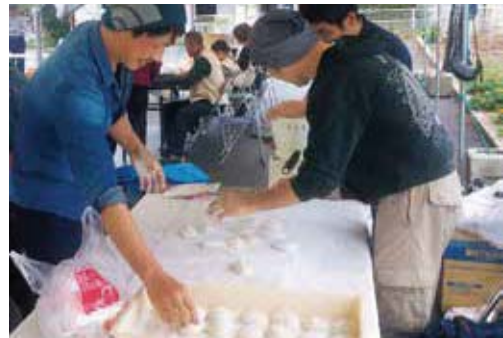
農業祭でのもちの販売