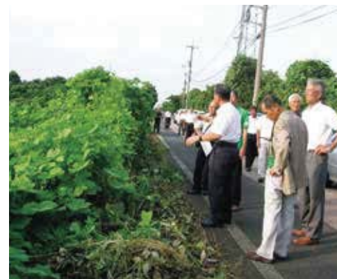
利用状況調査の現地研修

農業委員会活動のひとつに、農地利用状況調査(農地パトロール)があります。これは、町内の農地の利用状況を把握するとともに、遊休農地の発生防止・解消を目的に毎年行っているものです。