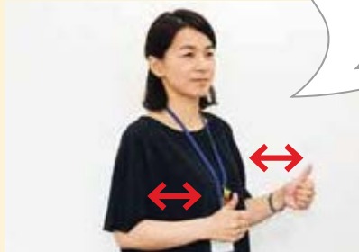
親指を立てた両手を交互に前後し、