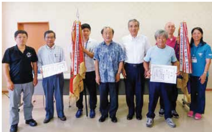
優勝旗を受け取った様子