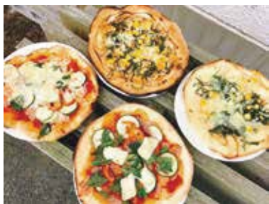
以西のピザ窯で焼かれたピザ

以西地区では旧小学校玄関前にピザ窯が設置されました。「あすの以西を創る会」のみなさんがD.I.Y (Do It Yourselfの略で、自分たちで創作すること)で設計から完成まで作りあげました。ピザもいただいたことがあります。窯で焼いた焼きたてピザは本当に美味しく、手が止まりませんでした。定期的開催されている軽トラ市やイベント時に食べられると思いますので、ぜひ一度ご賞味ください。