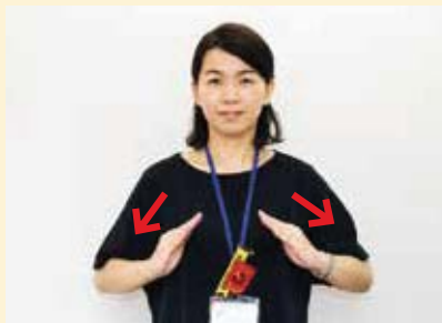
両手の指先を斜めにつけ合わせ、 同時に斜め下へ引く

※手話動作説明/一般財団法人全日本ろうあ連盟発行 「わたしたちの手話 学習辞典Ⅰ」より転載