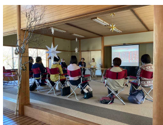
フィンランドトークイベント