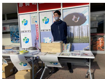
ポート赤碕フィンランド図書展示