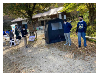
モルック体験イベント