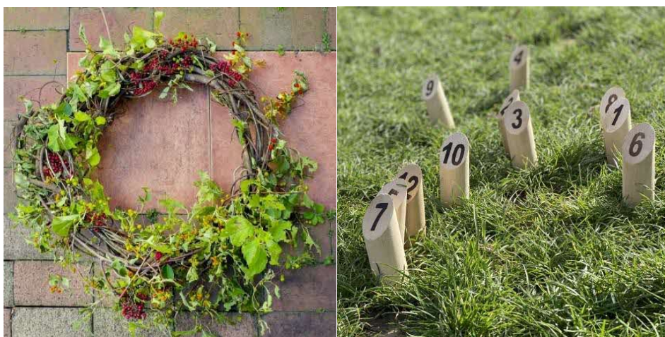
クリスマスリース作りは定員20名、材料費600円

私たちとフィンランドの接点は、サウナだけではありません。大人も子供も大好きな「サンタクローズ」の故郷であり、国連が発表する「世界幸福度ランキング」で4年連続第一位に選ばれた、憧れの北欧の国。そこで、昨年サウナのオープンにわざわざ駆けつけてくださったフィンランド大使館より再びお越しいただき、今度はクリスマスのお過ごし方や暮らしと文化についてお話を伺います。フィンランドにちなんだトークイベントと、クリスマスリース作りのワークショップ、フィンランドの国民的スポーツ「モルック」の体験もできます。