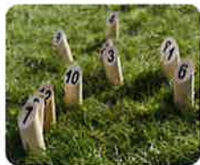
フィンランド発祥、いま話題の競技「モルック」を体験