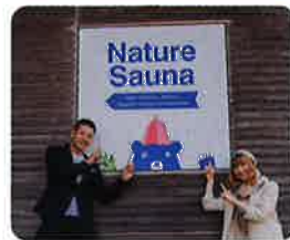
2020年秋オープンのNature Saunaはフィンランド大使館職員も太鼓判

フィンランドサウナが人気の一向平キャンプ場にフィンランド政府観光局より講師をお招きしてトークイベントとクリスマスリースの手作りワークショップを開催します。