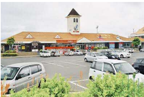
ポート赤碕では赤碕漁港直売所の新鮮な魚介が人気

琴浦町は、大山の裾野に広がる森林と農産物、お肉や牛乳などの畜産物と、日本海に育まれたアゴ(トビウオ)や白イカなどの新鮮な魚介類を楽しめる、多彩な自然と食の魅力にあふれた町です。サウナの御縁で今回フィンランド展が開かれる山間部と一緒に、ぜひ海沿いの風景や新鮮な魚介をご体験ください。イベント当日は、「ことマルシェ」開催中の道の駅ポート赤碕で、つくりたての「いかげそ天」(6日)と「あごカツ」(7日)の無料配布を実施します。また、イベント終了後の8日(月)から1週間は「一向へいこう」キャンペーンを開始、両会場を訪れるとポート赤碕で鮮魚が10%OFF、Nature Saunaのオリジナルグッズプレゼントなどの特典があります。