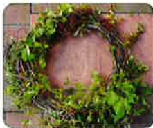
クリスマスリースを手作り。材料費600円、20名限定