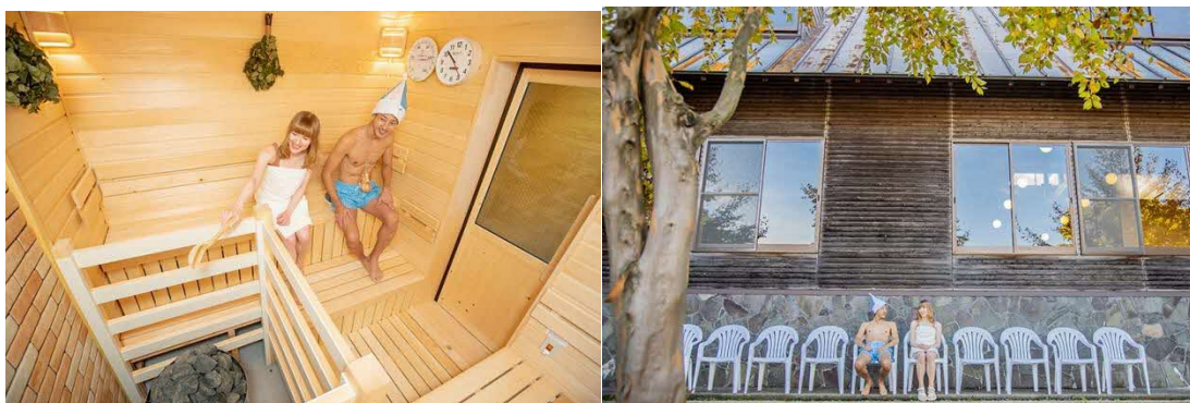
サウナストーンに水をかけるセルフフローリュ

2020年春にリニューアルされ、生まれ変わった一向平キャンプ場。特に、恵まれた自然との一体感を心ゆくまで満喫できるサウナ施設が人気を呼び、キャンプ場は琴浦町を代表する観光施設として見事に再生されました。全国のアウトドアファンとサウナーから高く支持された理由は、森林と豊かな水が織りなす国立公園の自然の素晴らしさと、それを存分に味わう手段として、本格的なフィンランド式のサウナにこだわったことにあります。