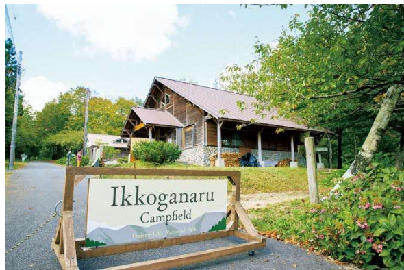
2020年リニューアルされた一向平キャンプ場