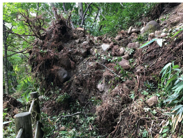
遊歩道の土砂崩れ