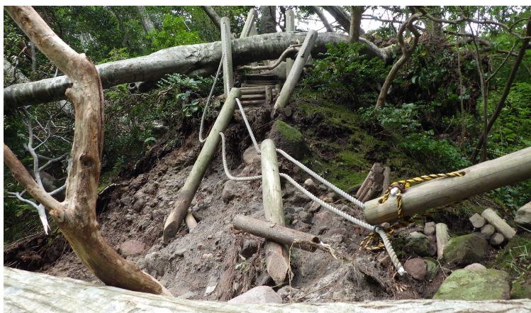
吊橋までの階段の状況

修復図面作成の業者を選定中であり、12月までに図面を作成、来年度予算での復旧工事を計画中