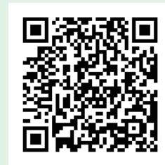
琴浦町 LINE 公式アカウント