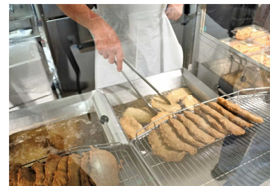
実演販売の実施 (イメージ)