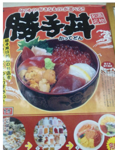
食の新メニュー開発 (イメージ)