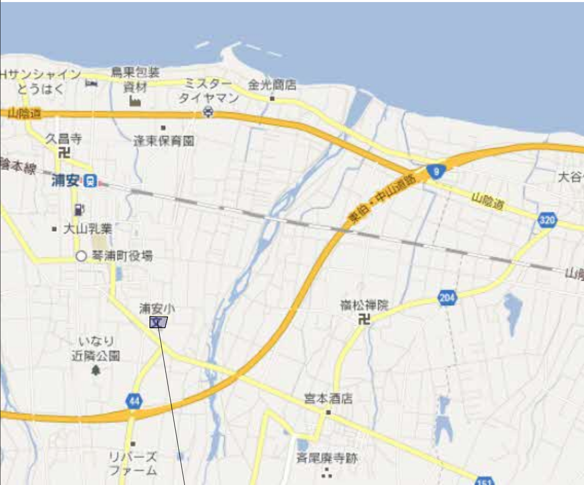
工事箇所：鳥取県東伯郡琴浦町下伊勢