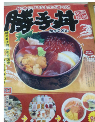
食の新メニュー開発 (イメージ)