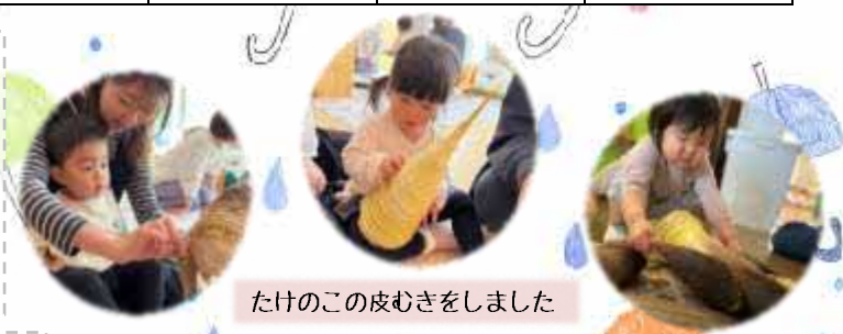
たけのこの皮むきをしました

布を巻いて、子どもたちが感触を楽しむじゅうたんを作ります。じゅうたん作りにはたくさんの古着や毛布、シーツなどの古布が必要です。ご家庭で使われていない布がありましたらご協力ください。