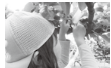
聖郷小学校小袋掛け作業の様子「傷つけないよう慎重に」

町では、総合的な学習の一環として、琴浦町の特産品である二十世紀梨の栽培体験学習を小学校で行っています。