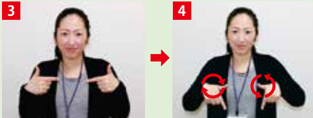
両手の親指と人差し指を伸ばして、向かい合わせる。