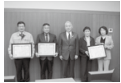
感謝状を持って記念撮影