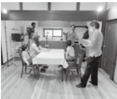
ミニドラマ撮影中の様子