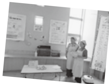
朝ごはんのおすすめレシピを配布