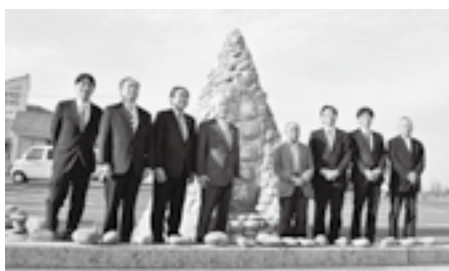
伝達式の後に、モニュメントの前で

地域の魅力を創出する良質な社会資本と、それに関わる優れた地域活動を一体の成果として表彰する「手づくり郷土賞」の平成27年度国土交通省大臣表彰に2月20日、鳴り石の浜プロジェクトが選ばれました。4月20日に鳴り石カフェで伝達式が行われ、国土交通省倉吉河川国道事務所長から認定証と記念盾の授与が行われました。