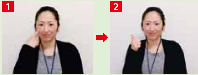
右手の人差し指をほおにあて、親指を立てて目より上の位置に上げる。