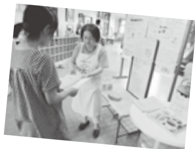
朝ごはん運動の様子