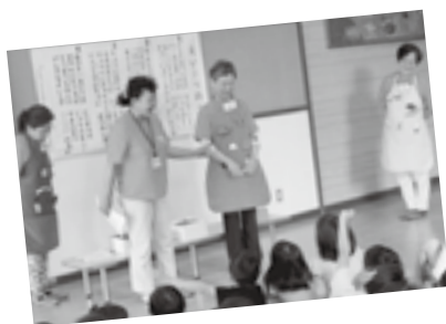
作成したエプロン