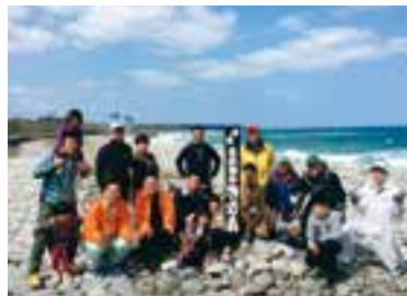
鳴り石の浜プロジェクトメンバー

本町では近年、多くの人や団体がまちづくりに取り組み、それぞれの地域や得意分野で町を盛り上げていただいています。毎月シリーズで、これらの取り組みを紹介していきます。