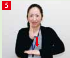
右手を垂直に立て、小指側で左手の甲をトンとたたく。

手話は、「手で表すことばで、目で見ることば」です。顔の表情も付け加えながらやってみましょう。