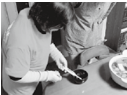
味噌汁塩分測定の様子

食生活改善推進員がご自宅を訪問したり、講習会の場で味噌汁の塩分測定を行っています。味噌汁の塩分濃度が気になる人は、ぜひ測定してみませんか。