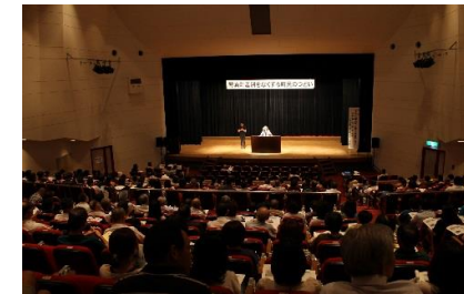
第11回琴浦町差別をなくする町民のつどい