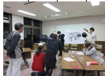
ファシリテーター養成講座(指導者養成)