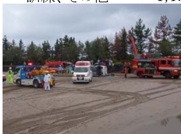
防災フェスタinことうら

○非常備消防事務経費 45,703千円 消防団の運営経費を支弁するとともに、各種災害に備えての訓練や研修を実施しました。 また、火災予防の啓発活動のため町内の巡回など行い、火災予防を呼びかけました。 町消防団は、現在、条例定数172人で実人員は162人で組織されています。 消防団報酬 7,849千円 団長 1人 副団長 6人 分団長 10人 副分団長 10人 班長 31人 機関員 40人 団員 64人 消防団出動手当 7,657千円 火災や各種訓練など、消防団員の出動に対して手当の支払を行ないました。 火災出動 208人 警戒 326人 訓練、その他 1,479人 全体 2,013人