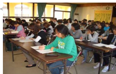
職員研修会の様子