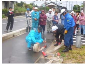
地域住民による初期消火訓練