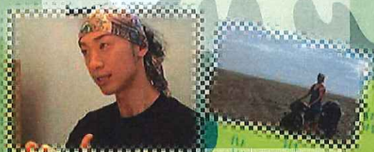
※自転車世界一周活動家