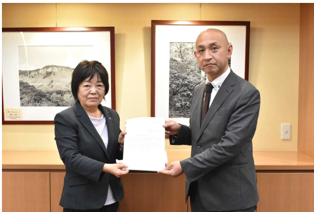
人権施策基本方針答申