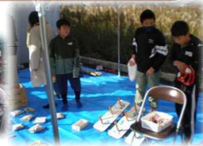
スポーツ推進委員