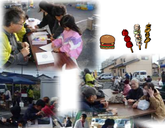
やばせキッズ・ゲームコーナー