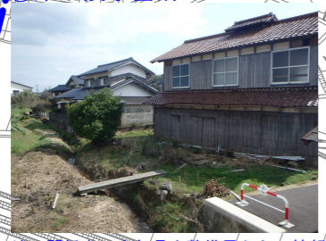
地元関係者、中部県土整備局からの情報 床下浸水は2月