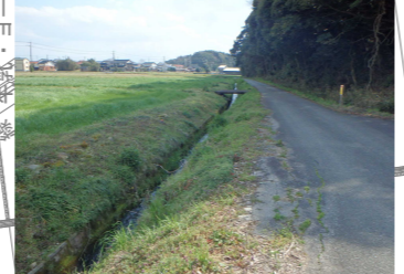
中部県土整備局からの情報