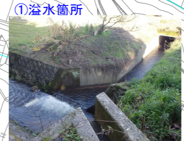
中部県土整備局からの情報