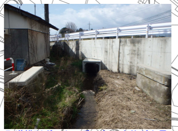
町道横断ボックス呑口部で水位が上昇したものと懸われる。