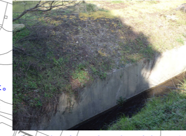
流入水路右岸側上部に洗堀が確認できる。