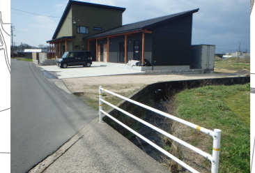
中部県土整備局からの情報 当時新築中で盛土が流出した。