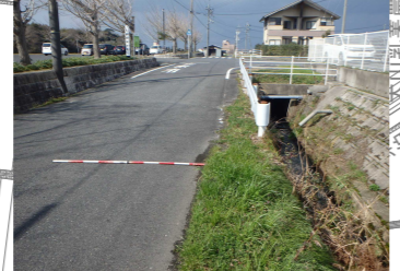
地元関係者、中部県土整備局からの情報