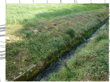
水路右岸側上部に洗堀が確認できる。