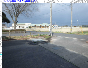
地元関係者からの情報 集水樹からの溢水で噴水のような様子であった。