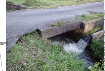
地元関係者、中部県土整備局からの情報 水路両側に洗堀が確認できる。