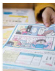
印刷物を主に、看板イラストなども手がける