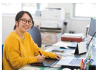
町から依頼されているポスターなどをデザイン中。ペンタブレットを愛用