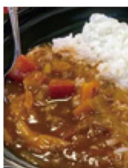
どんどんおいしく成長中のイノシシカレー