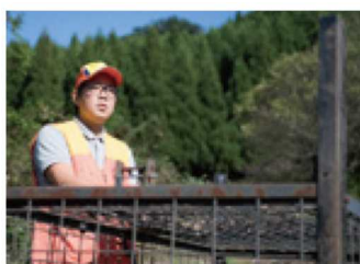
町内の2カ所にイノシシのワナを設置。一度に複数頭入ることもしばしば