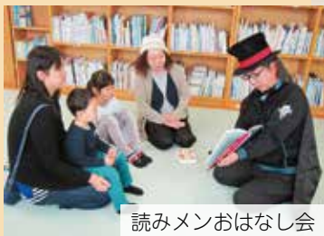
読みメンおはなし会