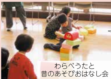
わらべうたと昔のあそびおはなし会