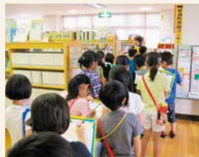
八橋小学校3年生 図書館見学風景

学校の校外活動として、図書館見学を受け入れています。たくさんの質問があり、図書館に関心を持ってきています。