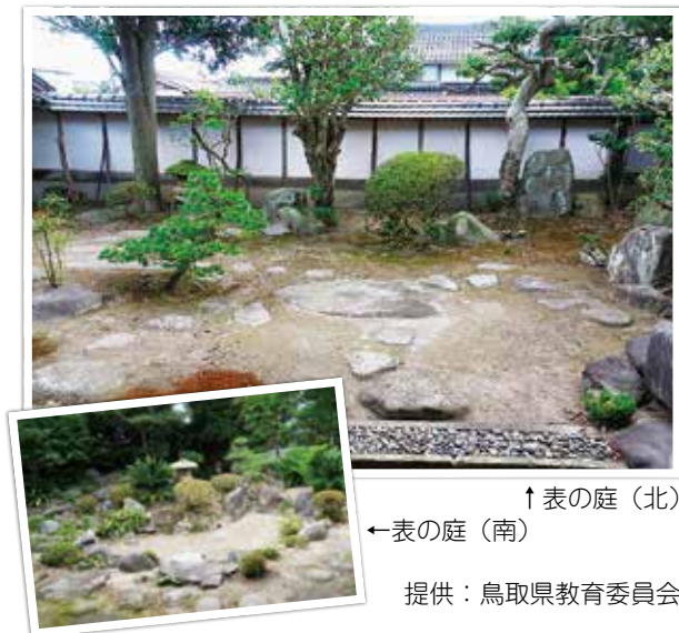
↑表の庭（北） ←表の庭（南）