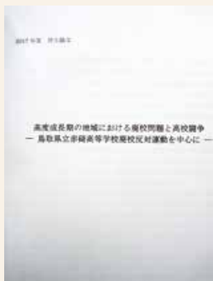
寄贈された修士論文

「ヒノキを山に植えたいので参考になる本は?」「旧東伯町・赤碕町の町章の由来がわかる資料はないか」…これらは実際におたずねのあった質問です。日々の暮らしで生じる疑問、「〇〇について調べているが、どんな本があるか」など、調査・研究に必要な資料探しを図書館がお手伝いします。お気軽におたずねください。