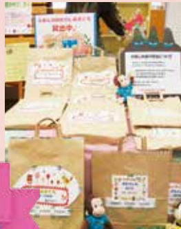
絵本のおたのしみ袋