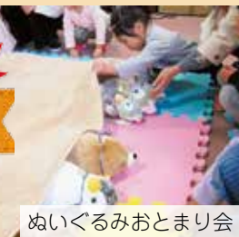
ぬいぐるみおとまり会