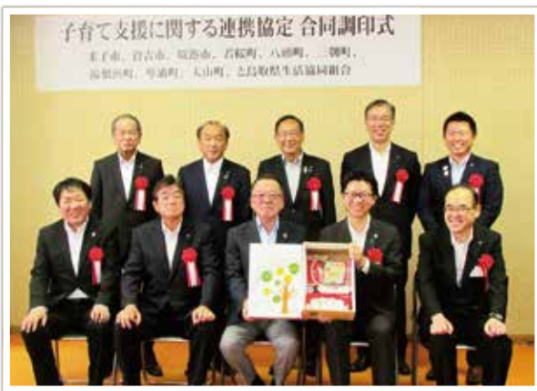
協定を締結した他自治体と共に

琴浦町と鳥取県生活協同組合（鳥取県生協）は、8月28日、米子市役所にて「子育て支援に関する連携協定」について、鳥取県生協と締結する他自治体と共に合同調印式を行いました。