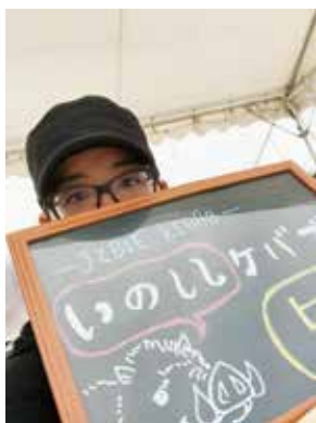
新作 ジビエケバブ はじめました

美味しい猪肉を鳥取県内に広げたいという思いで、町内の祭りでジビエ料理を出しています。メキシコ料理であるタコスアレンジしたジビエタコスやトルコ料理であるケバブをアレンジしたジビエケバブを出しました。次回は、10月14日に琴浦グルメでめぐるウォークin船上でジビエタコスを出店します。ぜひ、食べに来てください。