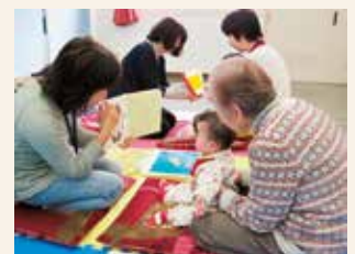
ブックスタートの様子