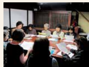
桐谷家住宅音読風景