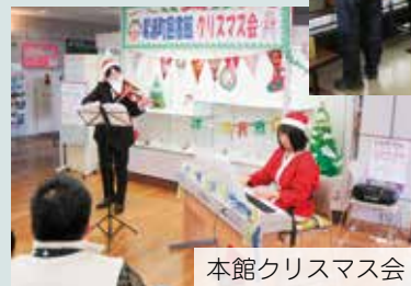
本館クリスマス会