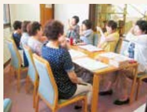
たんぼぼ音読会風景

毎週木曜日に図書館で音読会たんぼぼ、月に2回、桐谷家住宅で音読を実施しています。ぜひ、音読をやってみたいというグループがありましたら、図書館へ問い合わせください。