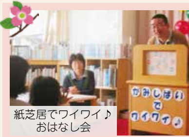
紙芝居でワイワイおはなし会