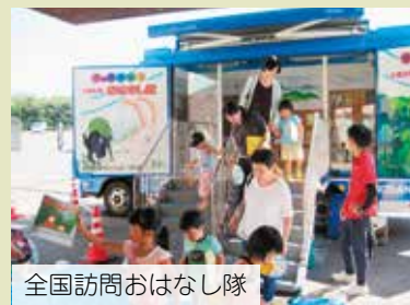
全国訪問おはなし隊