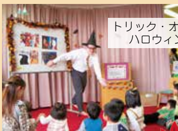
トリック・オア・トリート！ ハロウィンおはなし会