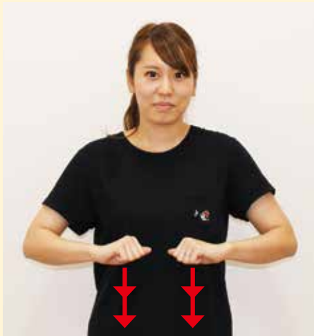
両肘を張り、胸前で向き合わせた 両手拳を同時に力強く2回下ろす

※手話動作説明/一般財団法人全日本ろうあ連盟発行 『わたしたちの手話 学習辞典Ⅰ』より転載