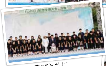
初披露の喜びと共に 記念撮影