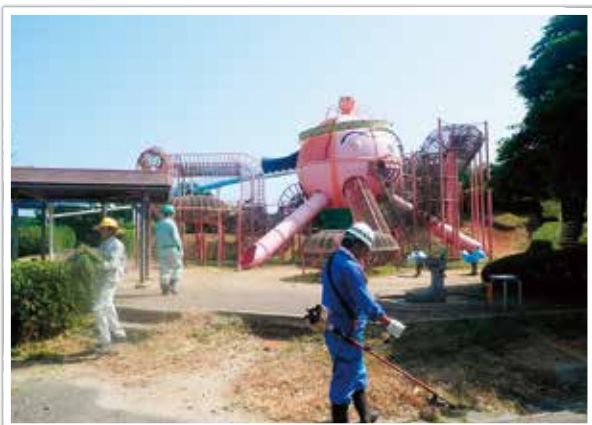
ふれあい広場の草刈作業の様子

作業終了後、早速に親子が公園を利用する姿があり、参加者からは「きれいにして良かった。気持ちよく利用してもらいたい」といった声があがっていました。