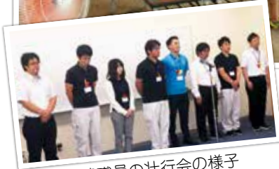
派遣職員の壮行会の様子