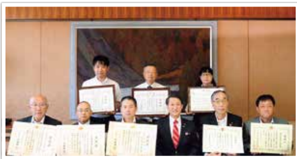
感謝状贈呈式にて

特に馬野建設では、献血当日を従業員が集まる全体集会の日に設定するなど効率的な献血協力者確保に努めた取り組みが評価されました。