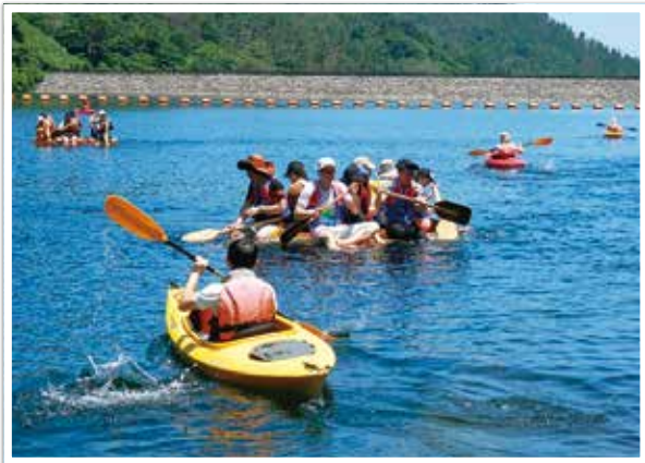
ダム湖でカヌーやいかだ体験を楽しむ参加者

6月24日（日）、町内の外国人を対象とした交流のつどいを開催しました。午前中は船上山のダム湖でカヌー・いかだ体験を行いました。はじめて体験する人が多い中、しばらくすると扱いに慣れ、自由にダム湖を回ることができるほどになりました。また、午後からは国の重要文化財である河本家住宅へ行き、昼食・抹茶体験を行いました。貴重な機会ということもあり、子どもから大人まで終始会話が尽きない楽しい交流となりました。