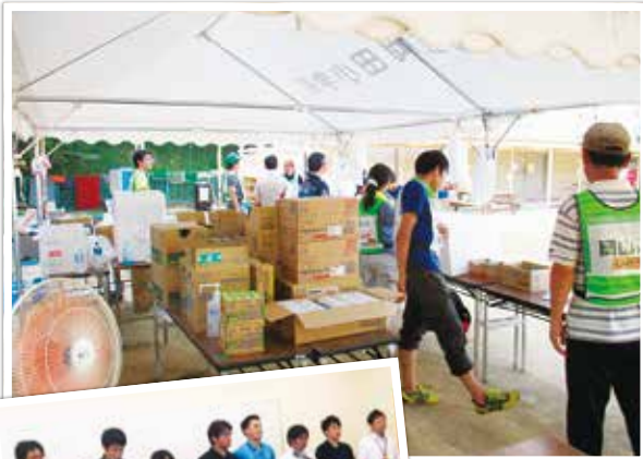
避難所を 運営する職員

派遣から帰った応援職員は、「甚大な被害に驚きました。たいへん暑い中でしたが、少しでも復興の力になろうと一生懸命努力しました。」と述べました。