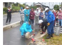
地域住民による初期消火訓練

○非常備消防事務経費 35,798千円 消防団の運営経費を支弁するとともに、各種災害に備えての訓練や研修を実施しました。 また、火災予防の啓発活動のため町内の巡回など行い、火災予防を呼びかけました。 町消防団は、現在、条例定数172人で実人員は162人で組織されています。 消防団報酬 7,889千円 団長 1人 副団長 6人 分団長 10人 副分団長 10人 班長 31人 機関員 人 団員 104人 消防団出動手当 9,077千円 火災や各種訓練など、消防団員の出動に対して手当の支払を行ないました。 火災出動 282人 警戒 325人 訓練、その他 1,352人 全体 1,959人 工事請負費 きらり公園土嚢ステーション建設 300千円