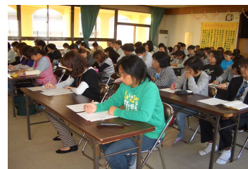
職員研修会の様子