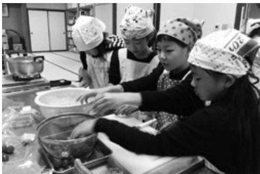
おいしくできますように