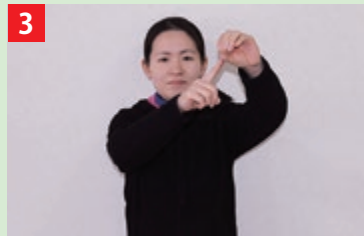
左手を丸めて筒を作り、上方におき、右手の人差し指をあてる。