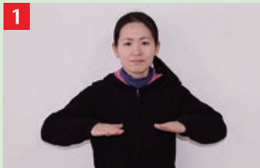
両手を下向きにして、体の前に置き少し下げる。