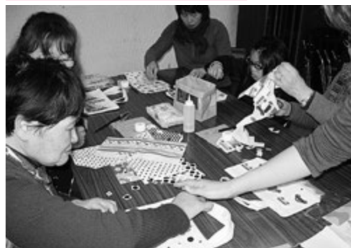
自分に似合う色と柄はどれかな?