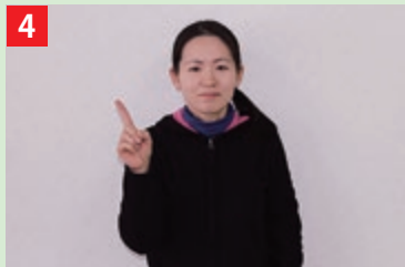
右手の人差し指を立てて、左右に軽く振る。