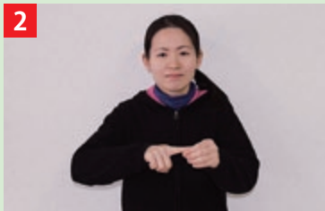
左手を丸め、右手の人差し指をトンとあてる。