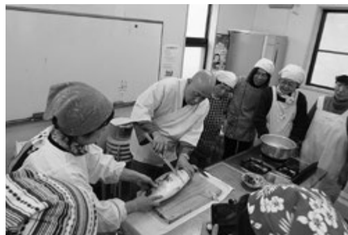
プロの技に釘付け