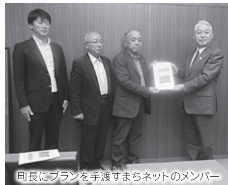
町長にプランを手渡すまちネットのメンバー

プランでは、まちづくりの 3本柱を「自然」、「歴史・文 化」、「農畜産物・海産物」と した行動計画と、移住定住促 進のため行政と民間の連携 強化などを提案しています。