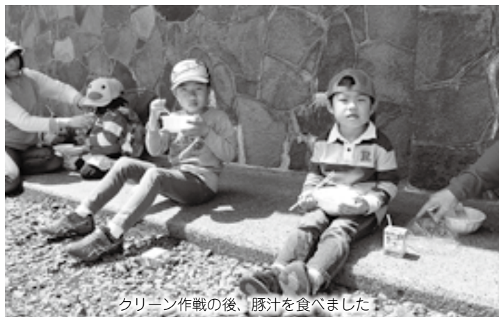
クリーン作戦の後、豚汁を食べました