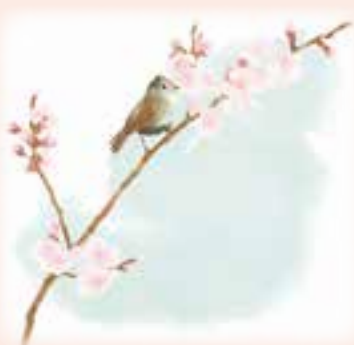
『鳥取県の民話・神話・伝説』より抜粋

男は仕方なく、しょんぼりと家を出ていきました。少し歩いて、未練そうに後ろを振り返ると、立派な屋敷や蔵はすっかり消えて、ただ一面の野原が広がっているだけでした。男は言葉を守って、いつまでも杳然と立ちつくしていましたとき。