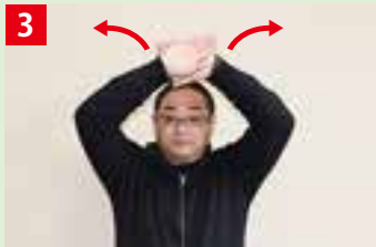
3 交差させた両手を、同時に左右に開く。 ★目の前が明るくなる様子を表現する。