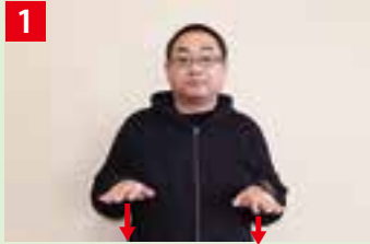
1 胸の両横に両手（前方に指先を向け、手のひらを下に向ける）を構え、同時に軽く下げる。