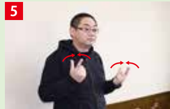
5 両手の親指と人差し指を開いて構え、指先をくっつける、離すを2回繰り返す。