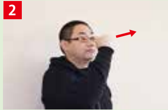
2 鼻の前から、利き手の握りこぶしを前に出す。