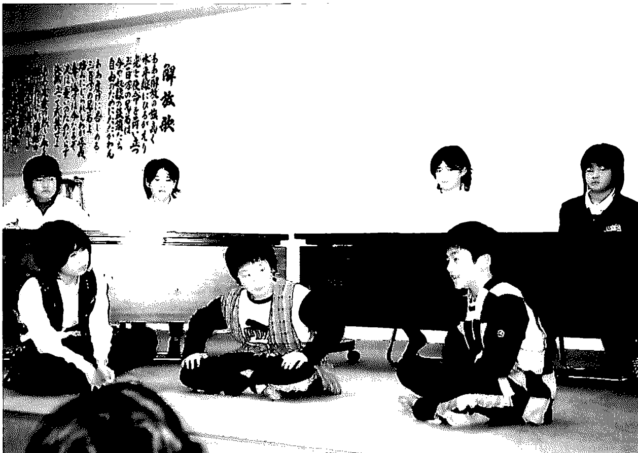
部落解放文化祭 浦安小学校5・6年生学習会で学んだこと「学習会の1年の歩み」の一場面