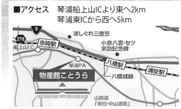
■アクセス 琴浦船上山ICより東へ2km 琴浦東ICから西へ5km ※琴浦PAからの入場のほか情報コーナー裏手口、北側の進入路からも入場できます。

オープニングイベントのお知らせ 10月14日(金) 竣工式 10:00~ 物産館ことうらOPEN 11:00~ 14日(金)~16日(日) 特産品などの屋台村